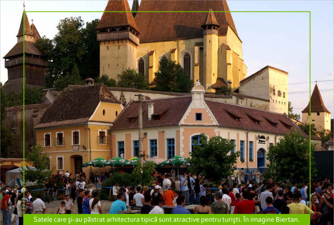
Satele care și-au păstrat arhitectura tipică sunt atractive pentru turiști. În imagine Biertan.