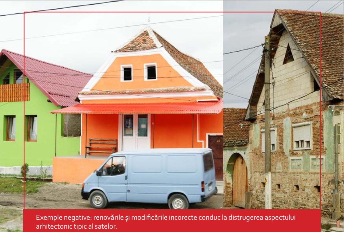
Exemple negative: renovările și modificările incorecte conduc la distrugerea aspectului arhitectonic tipic al satelor.

(Înlocuirea sau reconstruirea ferestrelor, obloanelor, ușilor, porților, fațadelor, acoperișurilor) și mai puțin prin construcții noi. Odată cu creșterea venitului, cu îmbunătățirea posibilităților de transport și mai ales cu accesibilitatea tot mai accentuată a materialelor de construcție de la lanțurile de supermagazine specializate deschise în tot mai multe orașe, procesul de schimbare a devenit neașteptat de rapid. Motivele sunt diverse: de la dorința sinceră de modernizare până la încercarea de a afecta un statut social urban. O altă cauză este dată de numărul mare de săteni din sudul Transilvaniei care lucrează ca muncitori sezonieri în țările UE, care, cu banii câștigați, cu experiența acumulată acolo și cu impresiile căpătate în urma contactului cu modul de construire occidental, introduc în satele lor de origine un amestec de stiluri constructive și decorative care nu au nimic în comun cu arhitectura tradițională a zonei. Se poate prevedea că în special satele aflate de-a lungul șoselelor națio-